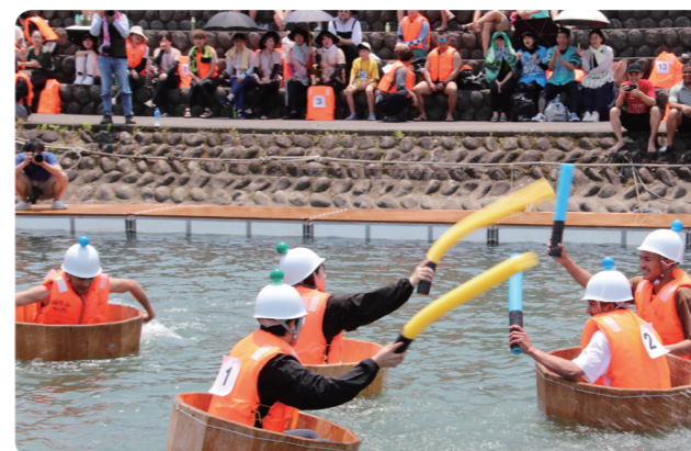
▲令和6年度の「ハンギリ源平合戦」の様子