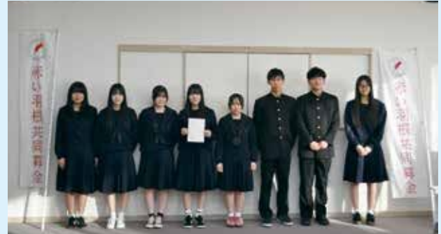
日田高等学校JRC部・生徒会