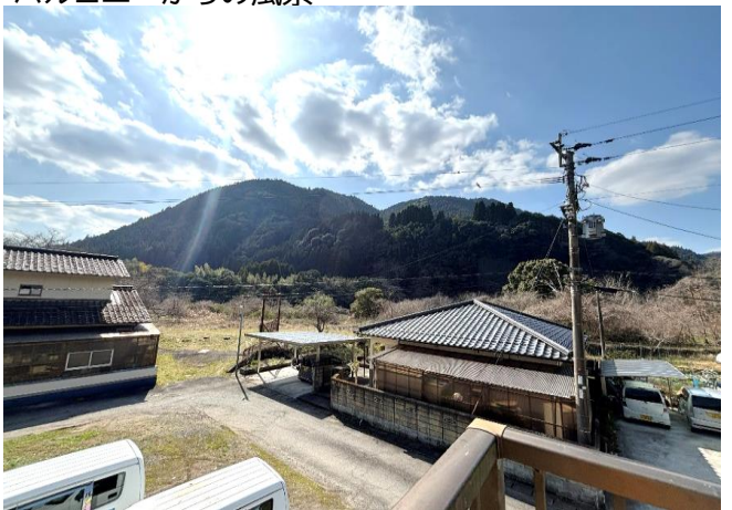
バルコニーからの風景